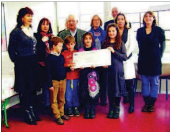
Délégués de classe, équipe éducative, parents d'élèves et Ogec avec le comité girondin de la Fondation Saint-Matthieu.