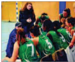
L'équipe de l'AS Saint-Delphin.

Dimanche 23 février, à 15 h 30, salle Nelson-Paillou, c'est le grand derby retour. L'AS Saint-Delphin rencontre l'US Talence, dans le cadre du Championnat de France féminin Nationale 3 poule B. La route vers les play-offs est dégagée, mais une saison n'est pas finie avant le dernier coup de sifflet du dernier match. Actuellement deuxième de leur poule derrière l'équipe de l'UT Orthez, les filles auront besoin de toute la famille du basket.